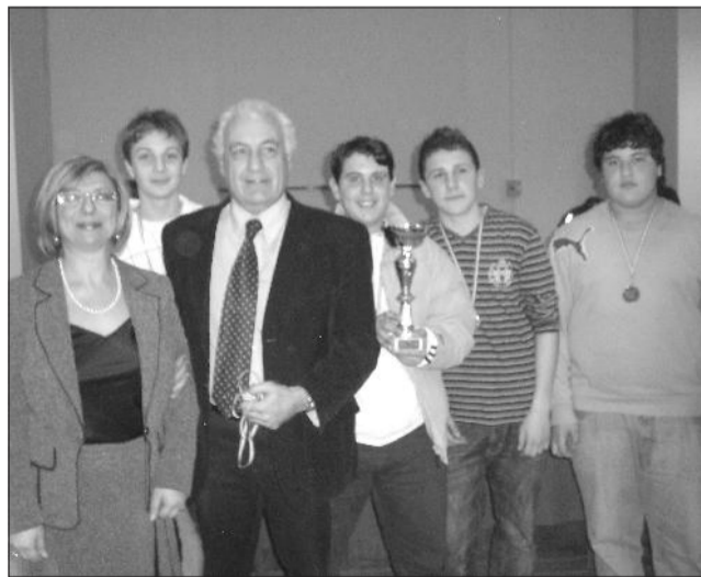
Nelle foto le scuole protagoniste della fase provinciale dei Gss: la Media Sacchetti Sasseti, l'Istituto Tecnico Geometri Ciancarelli, la Media Ricci, la Galilei di Santa Rufina, la Malfatti di Limiti di Greccio e lo Scientifico Jucci